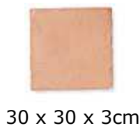
30 x 30 x 3cm