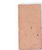
30 x 15 x 3cm