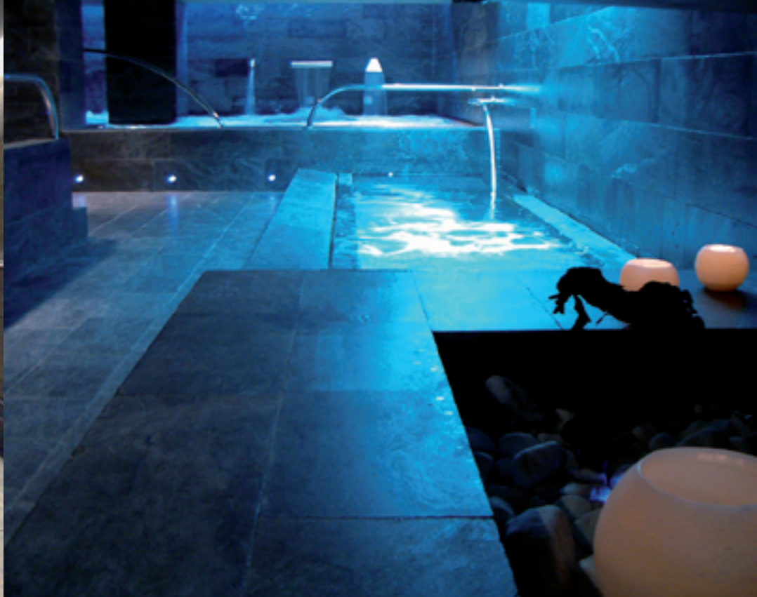
← Fotografías Freixanet - Saunasport

ción puntual, una buena opción es situar apliques o puntos de luz en espacios laterales para realzar el color, y todavía nos queda la opción de explotar la luz de tipo indirecto para sugerir ambientes relajantes, como por ejemplo el uso de difusores empotrados en el suelo.